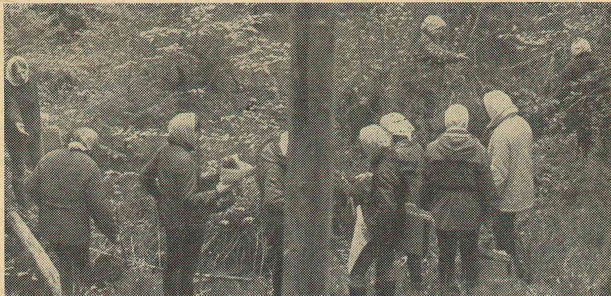
Студенты II курса ест-гео изучают флору окрестностей села Пологурово.