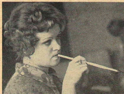
Первый курс. Все еще впереди, но муки творчества уже сейчас.