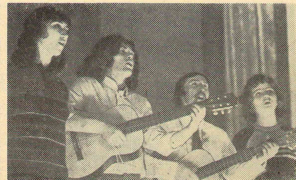
Ансамбль английского отделения.