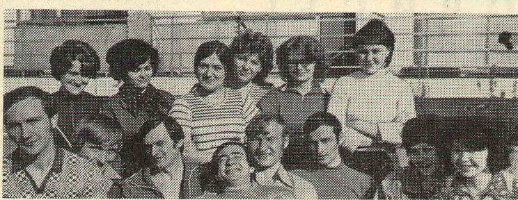
Командиры и комиссары ССО-76.

По прибытии отрядов во время были поданы отчеты некоторыми командирами и комиссарами. Думается, что выявленные ошибки вполне устранимы.