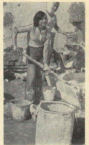
Возможно, придем работать в эту школу?!

Больше внимания надо уделять процессу формирования отрядов, и тогда их работа на местах дислокации будет организована четче. В этом году надо сформировать как можно больше отрядов в Омскую область.