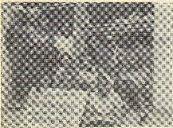
Студенты факультета иностранных языков на строительной школе в Ачарском совхозе.

Бойцы отряда «Аэлита» филологического факультета.