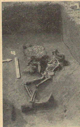
Грунтовой могильник. (Погребение Окунево)

У ног одного из погребенных были помещены две фигурки гуся, изготовленные из бронзы. Древним мастером переданы самые характерные черты этой птицы. Здесь же лежала бронзовая лапка гуся, которая за отверстие подвешивалась к нижней части фигурки птицы. В этом же погребении находились три брон-