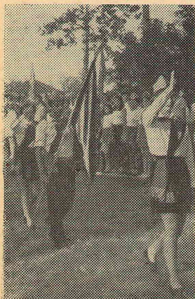
Торжественный момент. Вносятся знамя дружины. Линейка началась (п/л «Орленок»)