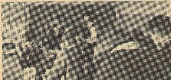
На уроке работают все.

И вот наши первые уроки... Не все и не у всех ладилось сразу, но разочарования не было, было лишь желание работать лучше. В этом, несом-