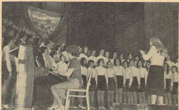
Выступает хор естественно-географического факультета педагогического института.

В результате такой совместной работы МК и администрации школа стала одной из лучших в районе, 9 лет подряд является победителем в социалистическом соревновании по подготовке к новому учебному году и награждается переходящим Красным знаменем. За десять лет в школе присвоено двум учителям почетное звание «Заслуженный учитель школы РСФСР», 12 человек награждены значком «Отличник народного просвещения», двое — орденами Октябрьской Революции.