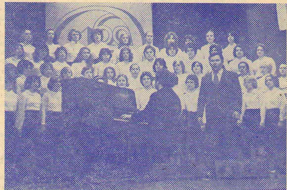
Поет хор естественно-географического факультета.

Начался фестиваль с тематического вечера «Мое Отечество — СССР», подготовленного математическим факультетом. Задача эта была необычайно трудной: силами одного факультета показать лицо института. Коллектив студентов и преподавателей с