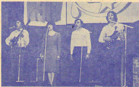
На сцене ансамбль исторического факультета.

ной работы, а не отчаянной попыткой хоть что-то показать (а отдельные номера в концертах ничем иным объяснить было невозможно). Факультет и страных языков обладает определенным опытом именно систематической, планомерной культурно-массовой работы, и, думается, необходимо найти время и место для того, чтобы представители факультета поделились с комсомольско-партийным активом своими достижениями. В институте давно назрела необходимость создания постоянного, а не временного, только на период смотра, централизованного органа по культурно-массовой работе — художественного совета. Кому, как не учителю, нести культуру в массы, независимо от его узкой специальности. Поэтому наши студенты должны успеть не только обнаружить свои таланты, но научиться еще и организовывать эти отдельные таланты в коллектив, создавать настоящую, нужную людям художественную самодеятельность.