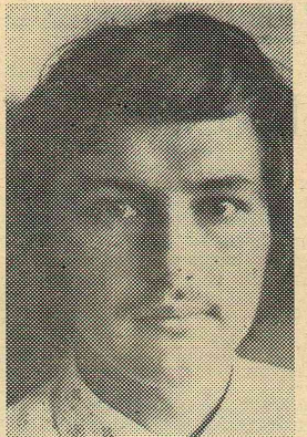
МЫ ТЕПЕРЬ УЖЕ СТУДЕНТЫ!