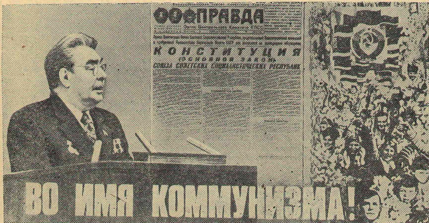
Плакат художника В. Арсенова. Изд-во «Плакат».

31 (473) ■ Среда, 5 октября 1977 г. ■ Год издания XIII ■ Цена 1 коп.