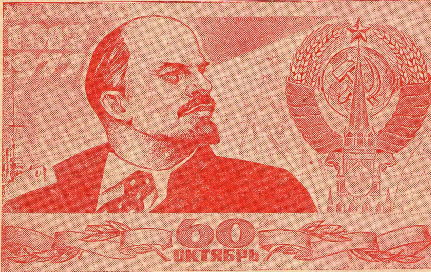
Плакаты издательства «Московская правда».

№ 32 (474) ■ Среда, 2 ноября 1977 г. ■ Год издания XIII. ■ Цена 1 коп.