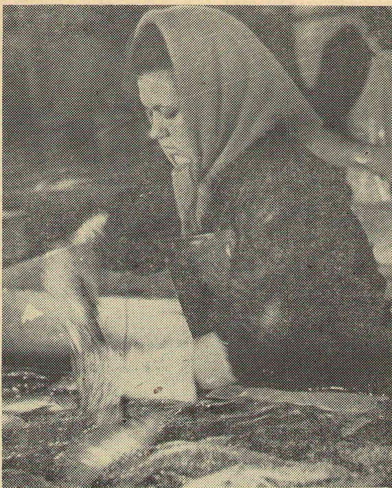
За работой. Сахалинский рыбозавод.