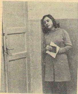
Что миг грядущий мне готовит?

Закоренелая школярская болельница — начинать ответ с самых далеких подступов — проявила себя и при анализе текстов. Басня И. А. Крылова «Волк и Кот» — счастливая возможность продемонстрировать экзаменационной комиссии умение вскрыть на конкретном примере авторский замысел, средства его выражения, образный строй! Так нет же. Студентка говорит про комедию великого баснописца, про его «Почту духов», про построение басен вообще... Зачем? Ведь для учителя нет ничего вредней многословия, неспособности (Окончание на 2-й стр.).