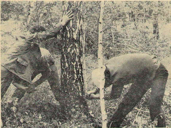
«Квант» (физфак) за работой.