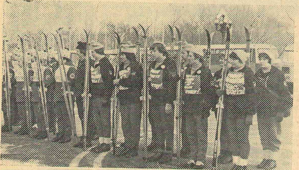
Участники агитпробега на старте.