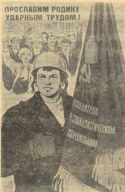
Плакат художника В. Сурьянинова. Издательство «Плакат».

История советских пятилеток — история построения развитого социализма, создания мощных производительных сил, подлинного расцвета науки и культуры. Ныне объем промышленной продукции в СССР превышает уровень 1928 года в сто двадцать восемь раз. Вместо миллионов раздробленных крестьянских хозяйств, оснащенных примитивным инвентарем, сельское хозяйство страны представляет теперь крупное механизированное производство. От пятилетки к пятилетке неуклонно повышается народное благосостояние, растут реальные доходы населения. Таким образом, наши планы служат достижению высшей цели социалистического общественного производства — наиболее пол-