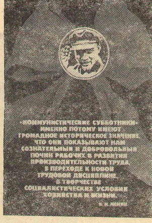
КОММУНИСТИЧЕСКИЕ СУББОТНИКИ - ВАЖНОЕ ПОПУЛЯРНОЕ МЕТОДЫ ПРОМЫШЛЕННОГО ИСТОРИЧЕСКОГО ЗНАЧЕНИЯ. ЭТО ОДИН ИЗ ВАЖНЕЙШИХ СПОСОБОВ ВОССТАНОВЛЕНИЯ И ДОВЕРЖЕНИЯ ПОЧВЫ РАБОЧИХ К РАБОТЕ И ПРОИЗВОДИТЕЛЬНОСТИ ТРУДА В ПЕРХОДЕ К НОВОМУ ТРУДОВОМУ ДВИЖЕНИЮ. СОЦИАЛИСТИЧЕСКАЯ УСТОЙЧИВОСТЬ ОБЩЕСТВА И ЧЕЛОВЕКА.

Шел военный 1919. год. Страна находилась в огненном кольце фронтов гражданской войны, испытывала большие трудности в продовольствии, сырье, военном снаряжении, боеприпасах. Не хватало транспортных средств, чтобы своевременно подвести продовольствие голодающим городам и боеприпасы на фронты гражданской войны. Прилагались большие усилия, чтобы увеличить производительность труда на фабриках, заводах и железнодорожном транспорте, работавших на оборону страны.