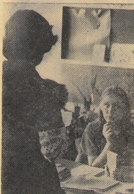
АТТЕСТАЦИЯ ПО ОПП