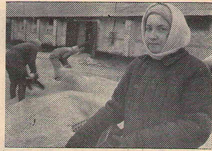
На Карбышевском хлебоприемном пункте трудились студенты начфака.