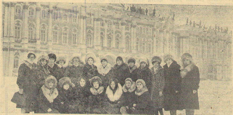
Участники поездки в Ленинград у Зимнего дворца

В центре внимания профсоюзной организации находятся вопросы быта, труда и отдыха. Так, в этом учебном году во время зимних каникул профкомом было организовано несколько групп, которые провели свои каникулы в домах отдыха, туристических поездках в столицу нашей Родины г. Москву и город-герой Ленинград, в молодежных лагерях. 80 студентов нашего института отдыхали в Черноморском доме отдыха с 26/1 по 6/II-80 г.