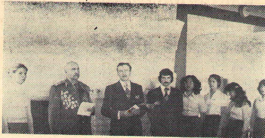
Митинг у мемориала — памятника студентам и преподавателям, погибшим в годы Великой Отечественной войны.

Но из всех факультетов хотелось бы отметить прежде всего матфак. Военно-патриотический месячник прошел у них на высоком уровне. Здесь были и встречи с ветеранами, и посещение музея ОВКДКУ, и коллективные просмотры кинофильмов. В 41-й гр. состоялась обсужде-