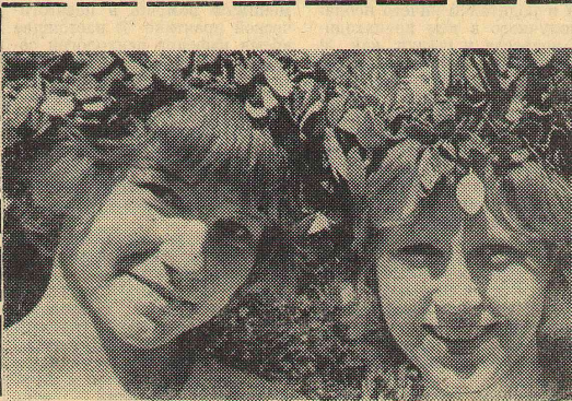
Фотоотд «Лето пришло» В. Швецова.