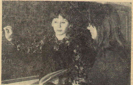
Малый иняз известен в школах города и области.

Очень не просто сочетать начало трудной учебы в институте с постоянной работой в педагогическом отряде, но в этом им помогает дружба, взаимная поддержка и помощь.