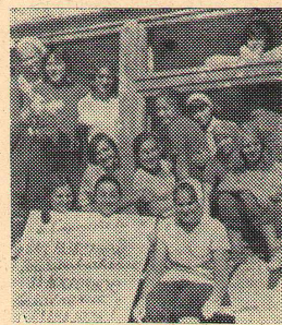
Из прошлого ССО. Инязовцы строили школу в селе.