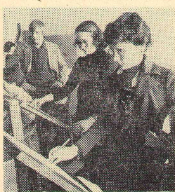
Принимают экзамены на заочном отделении ХГФ

К сожалению, наблюдается боязнь самостоятельных суждений, стремление оперировать только критическим материалом источников, не все хорошо и в достаточной мере знают тексты и совсем плохо знают историю. Филологу же без знания истории практически невозможно понять и осмыслить литературный процесс.