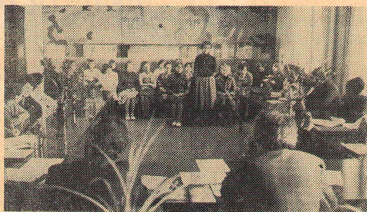
ПРИЕМНЫЕ ЭКЗАМЕНЫ И ЗАЧИСЛЕНИЕ НА I КУРС ОГПИ