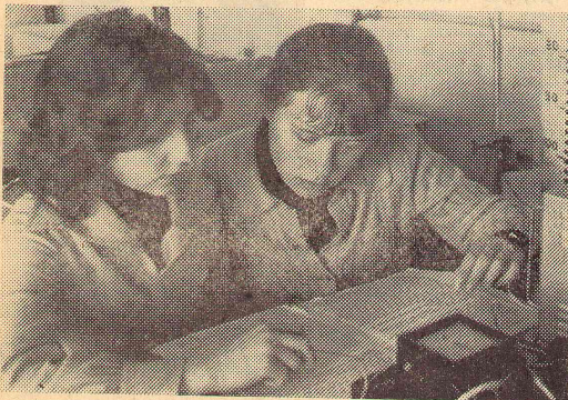
Студенты I курса физфака на занятиях.