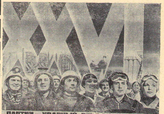
ПАРТИИ — УДАРНЫЙ ТРУД МИЛЛИОНОВ!

секретарь парторганизации факультета педагогики и методики начального обучения.