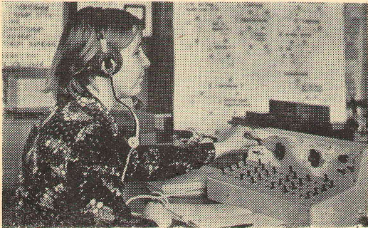
Обнаруженные с помощью алгоритмов пробелы в знаниях студентов охотно «срабатывают» в свободное от занятий время (с последующим контролем на машине «КИСИ-5»).