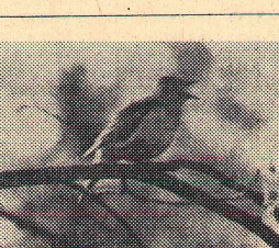
Весна пришла. Фотохуд. Ф.О.П.