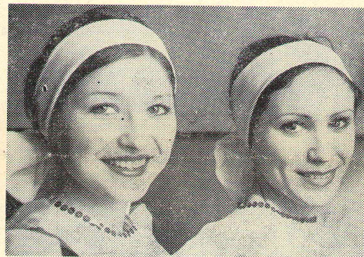
Участницы смотра с начфака

И все же отдельные недостатки не снимали общего приятно-печатления от абсолютного всех номеров и от концерта в целом. Ни одной «тройки» за исполнение, общая оценка «пятерка» и I место по институту — закономерный итог единства усилий всего факультета.