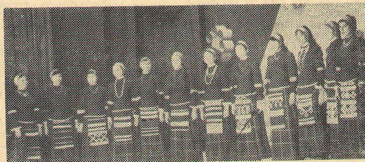
Знаменитый фольклорный ансамбль филфака.