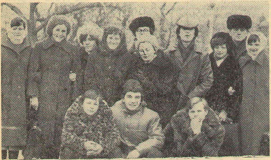
Группа рабфаковцев-историков (1980-81 уч. г.).