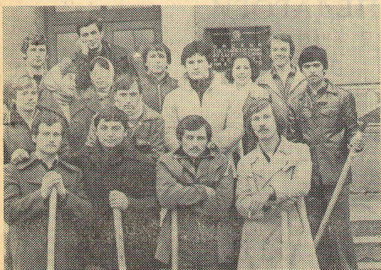
Вот это сила! Физики — рабфаковцы перед выходом на субботах.