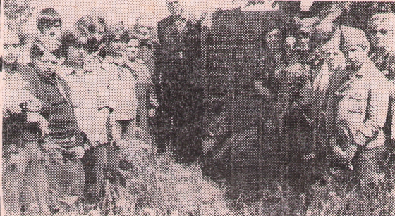
«Чтобы павшим героям вернуть имена». Под таким девизом в июне этого года поисковая группа школы № 75 г. Омска совершила поход по местам боев Кулагинской Краснознаменной дивизии. Ребята на месте бывшей деревни Кулагино.