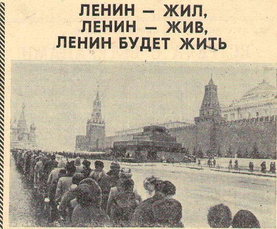
Москва. Красная площадь. К Ленину.