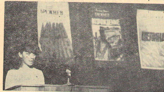
Каждое выступление было фотоклиповым