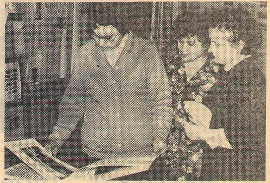
Учителя, участники семинара-совещания, знакомятся с методической выставкой, развернутой в ИУУ.