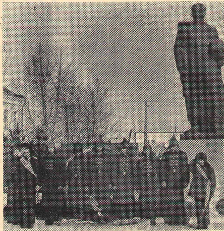
Минута молчания... Слет мальчишек у мемориала воинам-землякам, погибшим в Великую Отечественную войну.