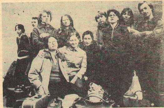
Каждую осень студенты в составе сельскохозяйственных отрядов едут на уборочную.