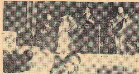
Ансамбль политической песни.

когда я уезжал из Новосибирска. Высшая радость для меня была в том, что я приобрел много новых друзей — людей моего возраста, которые мыслят так же, как и я, которые трудятся и творят в том же направлении, которое когда-то и я выбрал себе. Мы много говорили, спорили, смеялись. И не могли наговориться, насладиться, насмеяться — так было радостно на душе. Не часто встречаешь таких ребят, — не запяленных фальшью, искренних и отзывчивых — людей творчества, людей искусства. Я не боюсь громких слов, когда они не пустая патетика и напыщенная театральность, а жизнь, которая без грама просто непередаваема.