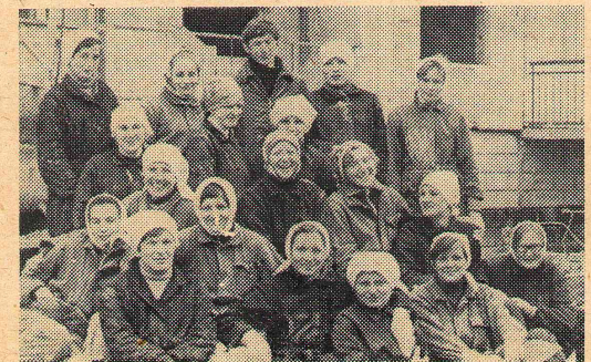
Каждое лето в составе нескольких строительных отрядов физики трудятся во славу Родины. Их труд приносит радость и удовлетворение.