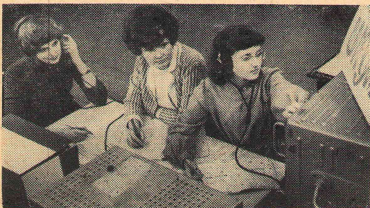
Члены радиоклуба — только девушки.