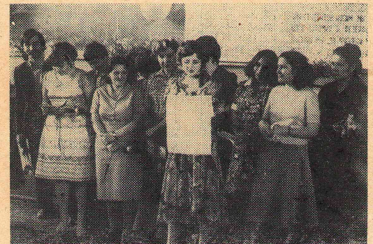
Каждый праздник у нас — творчество. Известны не только в институте наши «Дни физика». А это — праздник последнего звонка.