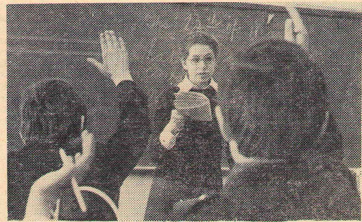
Ежегодно инязовцы проходят педпрактику в школах города и области.