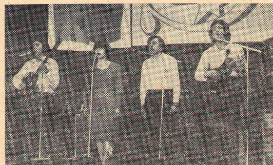
Ансамбль исторического факультета.

Наш факультет сейчас готовит преподавателей истории и совет-