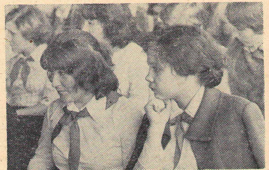
Идет итоговая конференция по пионерской практике.