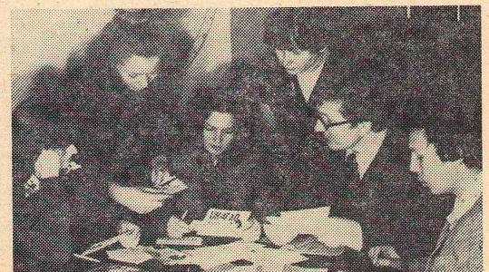
Радиокружок на физфаке пользуется популярностью.