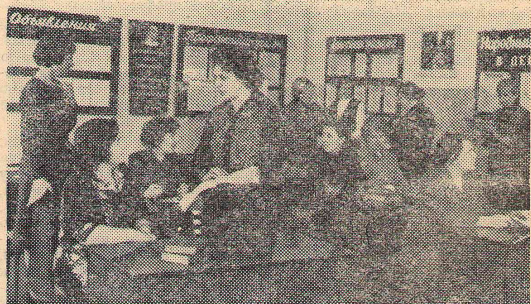
Плодотворная деятельность учительского коллектива зависит от создания необходимых условий труда. Особое внимание этому уделяет руководство и профсоюзный комитет средней школы № 19 г. Омска.