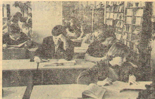
Идет семестр. вновь заполнены студентами все залы библиотек института.