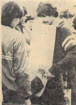
Нам еще предстоит трудная борьба.

«Нельзя терять время, ждать — не значит жить. Нужно успеть многое сделать».