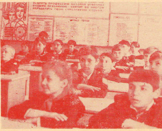
Кабинет профориентации школы № 16 Центрального района.