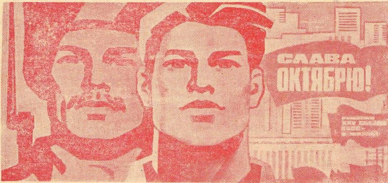
Плакат художника И. Комнарца. Издательство «Плакат».