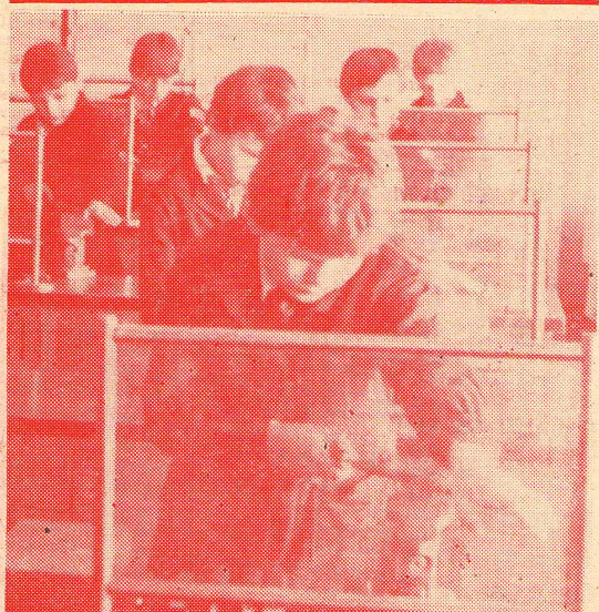
УРОК ТРУДА — УРОК ЖИЗНИ