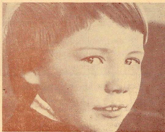
А ты какой оставишь след?

19. Школьники принимают активное участие в благоустройстве и озеленении территории базового предприятия, выполнении установленного для него задания по сбору вторичного сырья, в культурно-массовой работе на предприятии, шефству над его детскими дошкольными учреждениями, оказывают помощь в заготовке кормов, уборке урожая, проведении других сельскохозяйственных работ, уходе за лесом, участвуют в мероприятиях по охране природы.