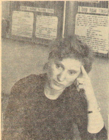
Как достучаться до их сердец?

В рамках партии Центрального района состоялся семинар редакторов стенных газет. Отмечено небрежное оформление газет, представленных от пединститута, незнание структуры стенной газеты, информативность изложения материала. Сейчас в институте организованы кружки оформителей стенных газет, которыми руководят студенты худграфы. А. ВАСИЛЬЕВ, слушатель отделения журналистики ФОПа.