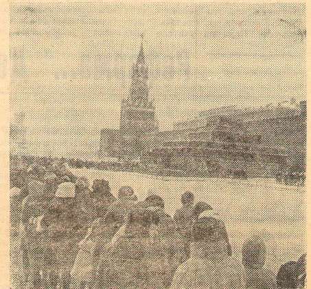
Москва. Красная площадь. Нескончаем поток людей к Мавзолею В. И. Ленина.

В. ТИМОФЕЕВ, полковник медслужбы в отставке.