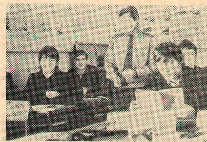
Идут занятия по НВП.