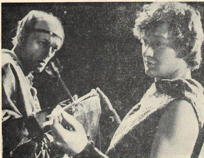
В Омском ТЮЗе с успехом идет диалог А. Володина «Две стрелы» и «Ящерица».

На фото Б. Метцгера сцена из спектакля «Две стрелы».