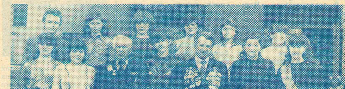
На СНИМКЕ: студенты 32 группы факультета физики на встрече с ветеранами Великой Отечественной войны.