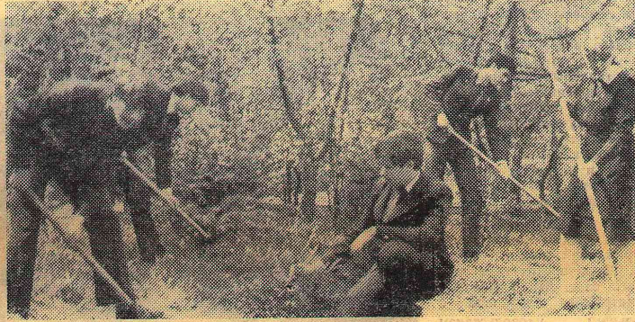
НА СНИМКЕ: на пришкольном участке в школе № 93.