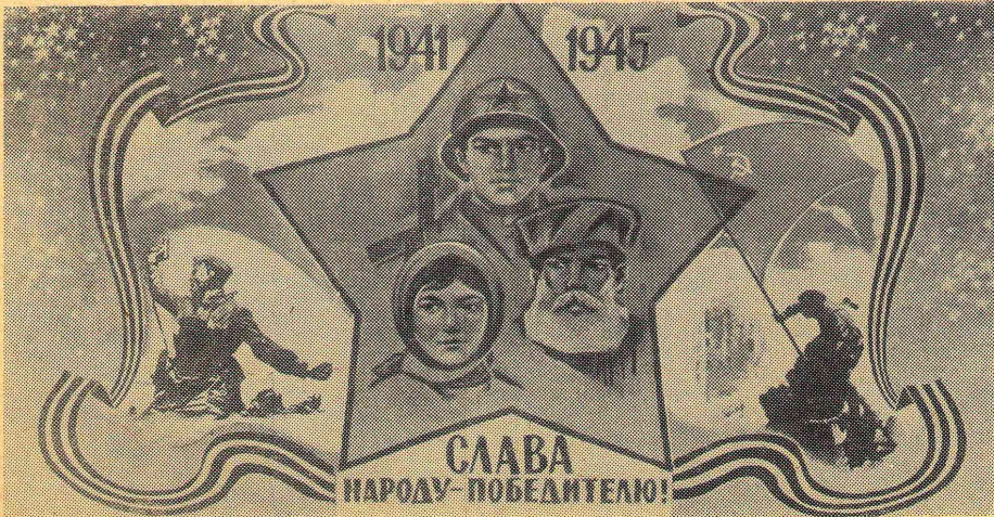
Плакат художника В. Сачкова.