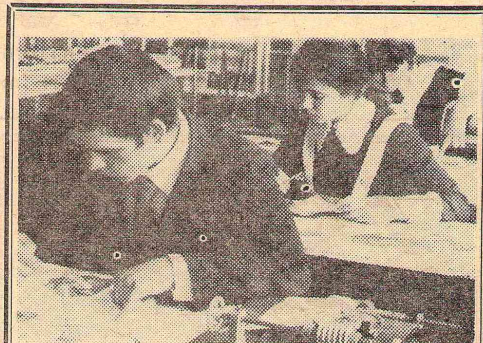
Идет урок машиноведения в Пановской средней школе Крутинского района.

Из комсомольско-молодежного коллектива Алексеевской средней школы Горьковского района работали 20 старшеклассников. Восемь ребят трудились самостоятельно, 12 — помощниками комбайнеров. Дневная норма выработки составля-