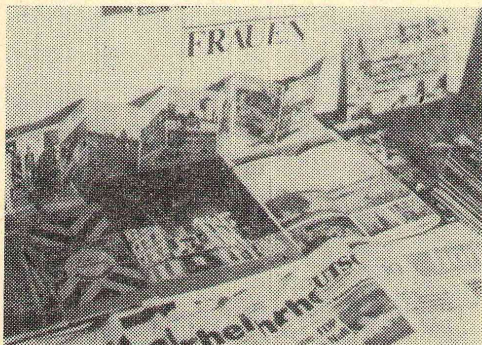
Фрагмент стенда «Путешествие по ФРГ».