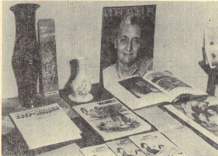
Большое внимание посетителей привлёк уголок Индии.

Население Омской области составляют 70 национальностей и народностей. А представители 32 наций участв в нашем институте.